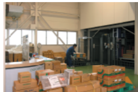
荷造・配送出荷部