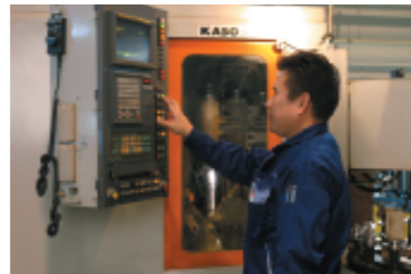
加工・組立製造部