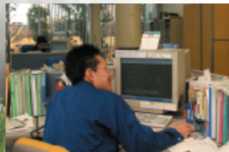
企画・設計技術部