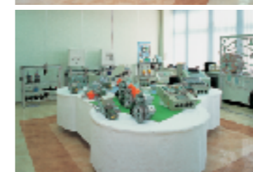
exhibit space — 製品展示スペース

大人数で行う会議や、講習会、勉強会に使用しています。講習会にはこれからのメーカーにあるべく品質管理や、製品開発の基礎知識の習得などといったメニュー展開に勉めています。