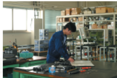
製品検査・品質管理部

最新機器とネットワーク化により整備された環境の中で製品の開発から出荷までを一貫した体制で、時代の流れをスピーディーに対応しています。